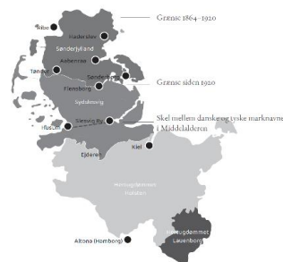
Sønderjylland før og nu